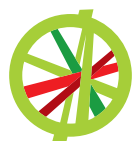
MANUEL ALEGRE PRESIDENTE 2011

Queremos que a esperança seja devolvida aos cidadãos e sabemos que o nosso país não é inviolável. Manuel Alegre tem um percurso de coerência, de ética republicana e de serviço público. É urgente começar a lutar hoje por um futuro mais exigente e mais justo. Sim, não tenhamos medo das palavras. Queremos, de novo, um país novo.